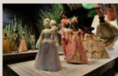
Centre National du Costume de Scène et de la scénographie ☎ 04 70 20 76 20 - www.cncs.fr