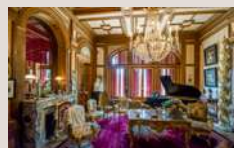
Maison Martin ☎ 04 70 20 48 47 http://musees.allier.fr