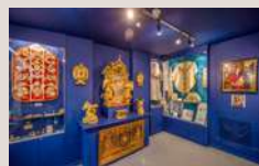
Musée de la Visitation ☎ 04 70 44 39 03 www.musee-visitation.eu