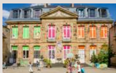
Musée de l'illustration jeunesse ☎ 04 70 35 72 58 http://musees.allier.fr