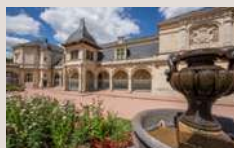
Musée Anne de Beaujeu ☎ 04 70 20 48 47 http://musees.allier.fr